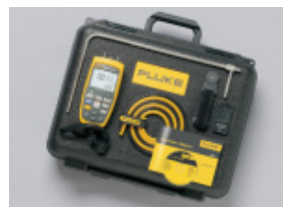
Kit Fluke 922