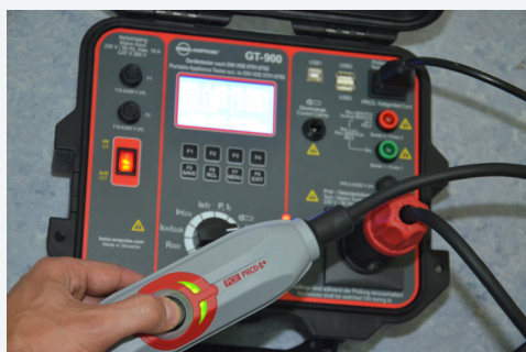
Test des disjoncteurs différentiels mobiles (PRCD, PRCD-S, PRCD-S+, PRCD-K).