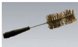
Sonde à brosse PAT-BRUSH Technique d'enfichage 4 mm