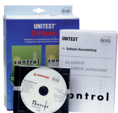
0701/0702/0113 Logiciel de contrôle professionnel