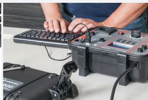
Trois interfaces USB séparées pour le raccordement simultané d'un PC et d'un appareil de saisie, par exemple : clavier USB, lecteur de codes-barres USB, clé USB ou appareils Bluetooth via un dongle USB (en option)