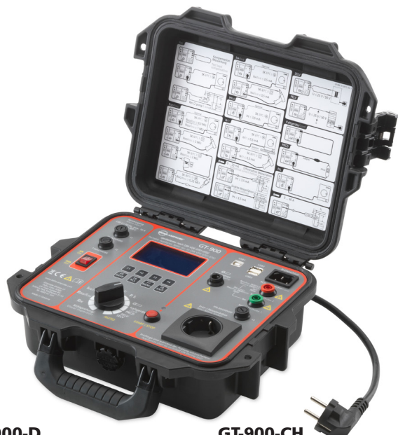
GT-900-D Testeur d'appareils pour les contrôles conformes aux normes DIN VDE 0701-0702 et DGUV Directive 3 (BGV A3) avec câble réseau Schuko et prise secteur/test Schuko.