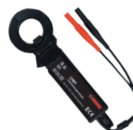
Adaptateur de pince de courant de fuite CHB 1