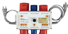
VLP-5 Adaptateur de test de rallonge pour courant triphasé