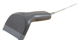
BC-1250G, noir Lecteur de codes-barres avec câble USB