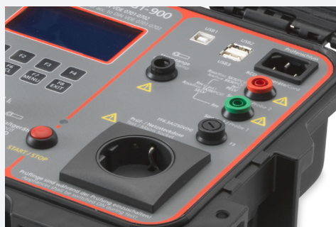
Raccordement pour adaptateur de pince ampèremétrique externe (Beha-Amprobe CHB 1 en option) pour la mesure des courants du conducteur de protection, notamment sur les appareils triphasés