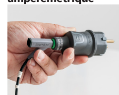
Adaptateur PE pour conducteur de protection