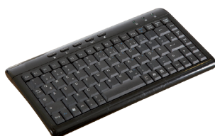
KBGE-MT204S Clavier USB