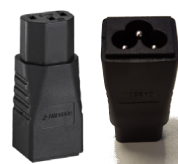
PA-1 Adaptateur appareils à froid sur trèfle (EI C6-C13)