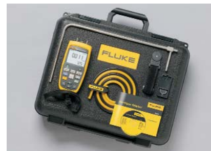
Fluke 922 Kit

Datenspeicher: 99 Messwerte Abmessungen HxBxT: 17,5 cm x 7,75 cm x 4,19 cm Gewicht: 0,64 kg Batterie: Vier Batterien Typ AA Batterielebensdauer: 375 Std. ohne Hintergrundbeleuchtung, 80 Std. mit Hintergrundbeleuchtung Zwei Jahre Gewährleistung