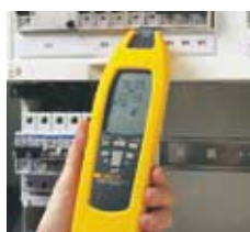
Auffinden von Sicherungen und Sicherungsautomaten und Zuordnung zu Stromkreisen