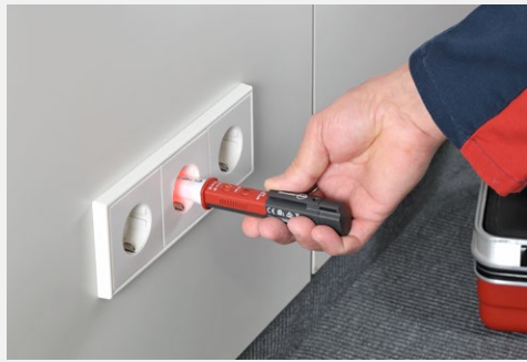
Überprüfung von Steckdosen auf Wechselspannung und Polarität