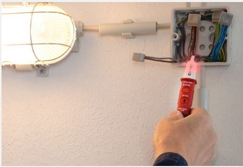
Prüfung auf Vorhandensein von Wechselspannungen für die schnelle Fehlersuche